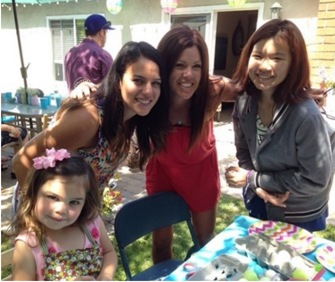
学生与美国寄宿家庭共度周末