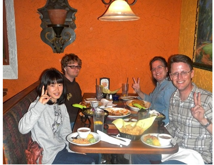
学生与美国寄宿家庭在餐厅共进晚餐