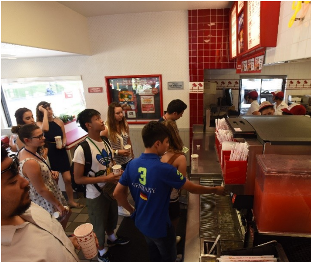
来自世界各地的学生一起学习在美国餐厅点餐